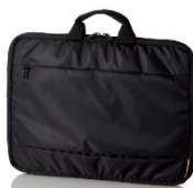
取っ手付きインナーバッグ

パソコンを持ち歩き時に衝撃から守るインナーバッグ。パソコンの一斉入れ替えのときに配布しやすいオトクな5個入りが登場しました。