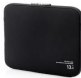
ネオプレン素材インナーバッグ