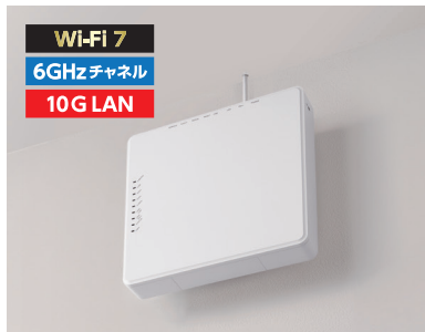
Wi-Fi 7対応 アクセスポイント