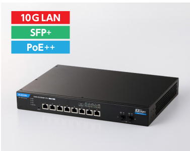
10G PoE Webスマートスイッチ

最新規格Wi-Fi 7に対応した法人向けアクセスポイントです。2.4/5/6GHzのトライバンドとMLOにより、多数の端末が同時接続しても高いスループットと安定した通信品質を提供します。クラウドサービスを前提とした業務利用に適しています。