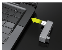
케이블이 없는 직접 꽂는 타입