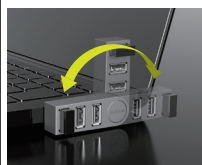
270° rotating swing connector